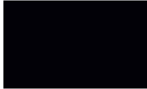
Tooling 1000 RAL CLASSIC 9005