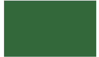
MIG 6100 RAL CLASSIC 6001